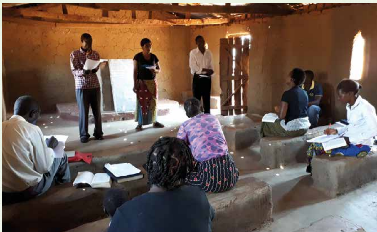
Zondagschooltraining voor volwassenen

Het doel van de organisatie werd om zo veel mogelijk mensen in Petauke district - in oostelijk Zambia - in aanraking te brengen met Gods Woord. En dat doel heeft Stéphanos Zambia nu nog steeds!