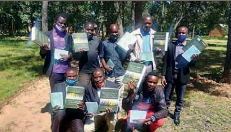
Deze studenten van de Bijbelschool zijn erg blij met het bijbelcommentaar van Matthew Henry