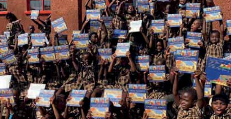
Deze partnerorganisatie heeft vijfhonderd door ons vertaalde kinderbijbels uitgedeeld op hun school